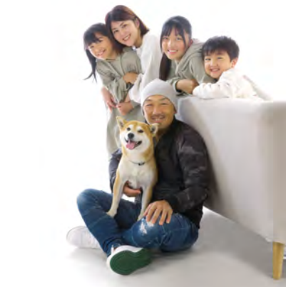
安部宜秀写真館（福岡県飯塚市）