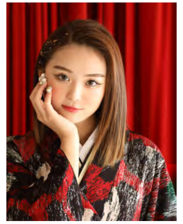
横田淳（有）よこた写真館（香川県琴平町）