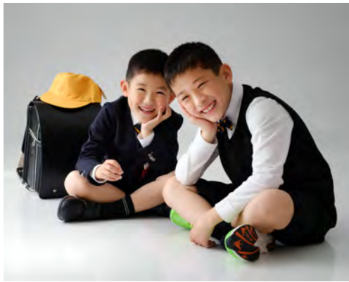
加藤大智カトー写真館（愛知県安城市）