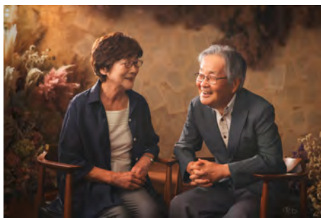
吉田丰吾（有）吉田写真館（茨城県牛久市）