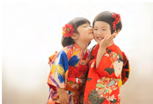
今井英子今井写真館（新潟県長岡市）